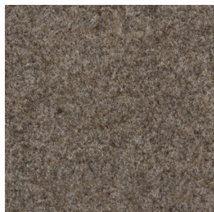
5012 4 m