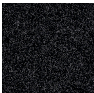
5002 4 m