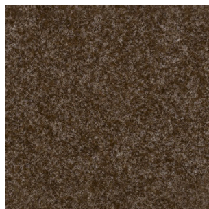
5042 4 m