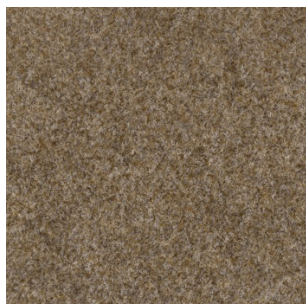
5022 4 m